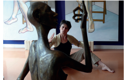
Exposition collective au Foyer d'Animation pour Tous d'Ugine