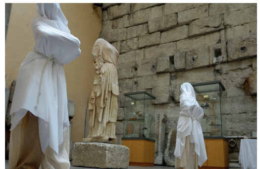
Temple de Diane - Aix les bains