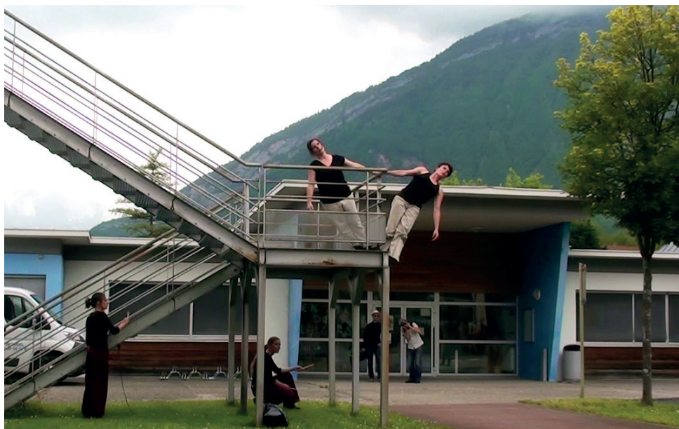
Exposition collective au Foyer d'Animation pour Tous d'Ugine